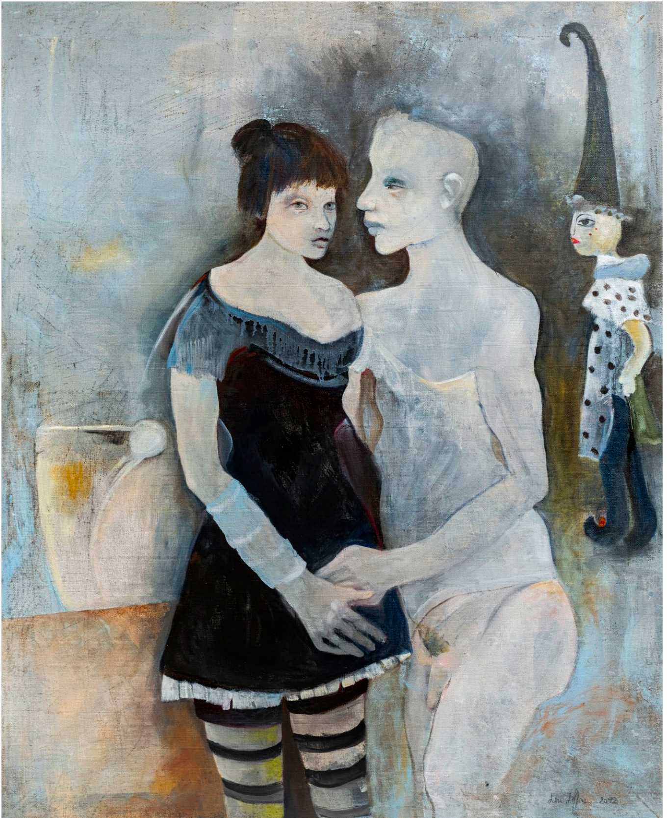
Sans titre, huile sur toile, 130 x 97 cm, 2022