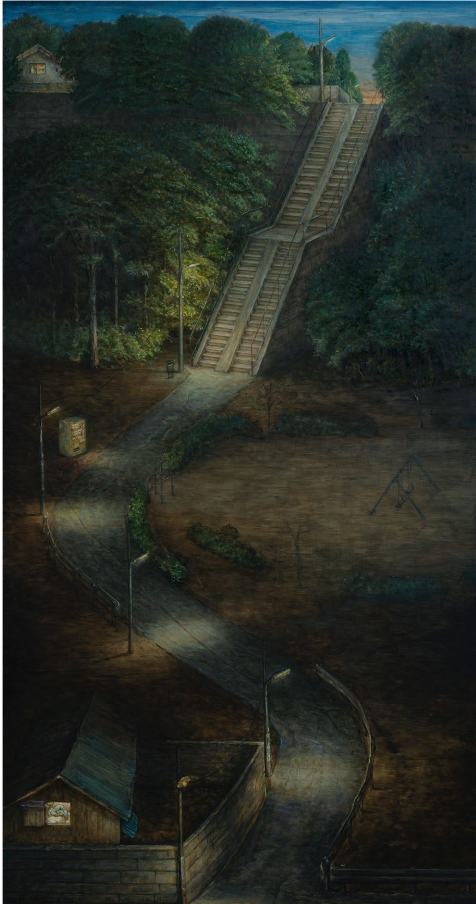
Sans titre , huile sur bois, 103.5 x 54.5 cm, 2022