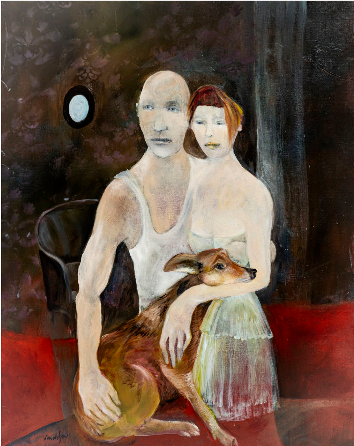
Sans titre, huile sur toile, 100 x 80 cm, 2021