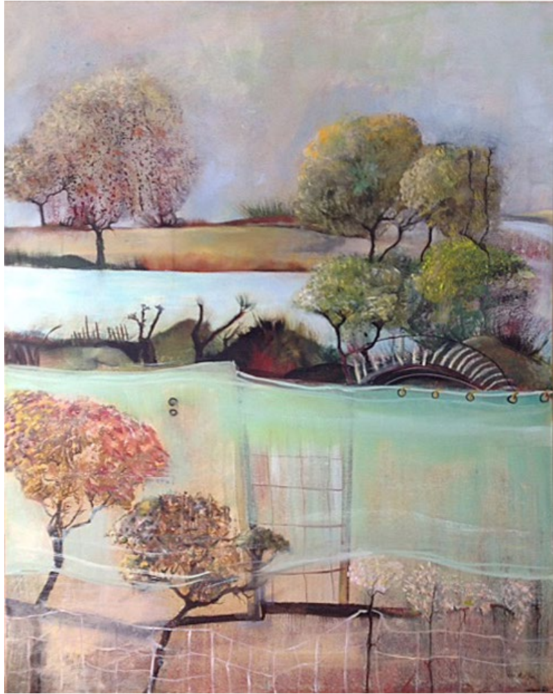
Paysage de là-bas, huile sur toile, 100 x 80 cm, 2020