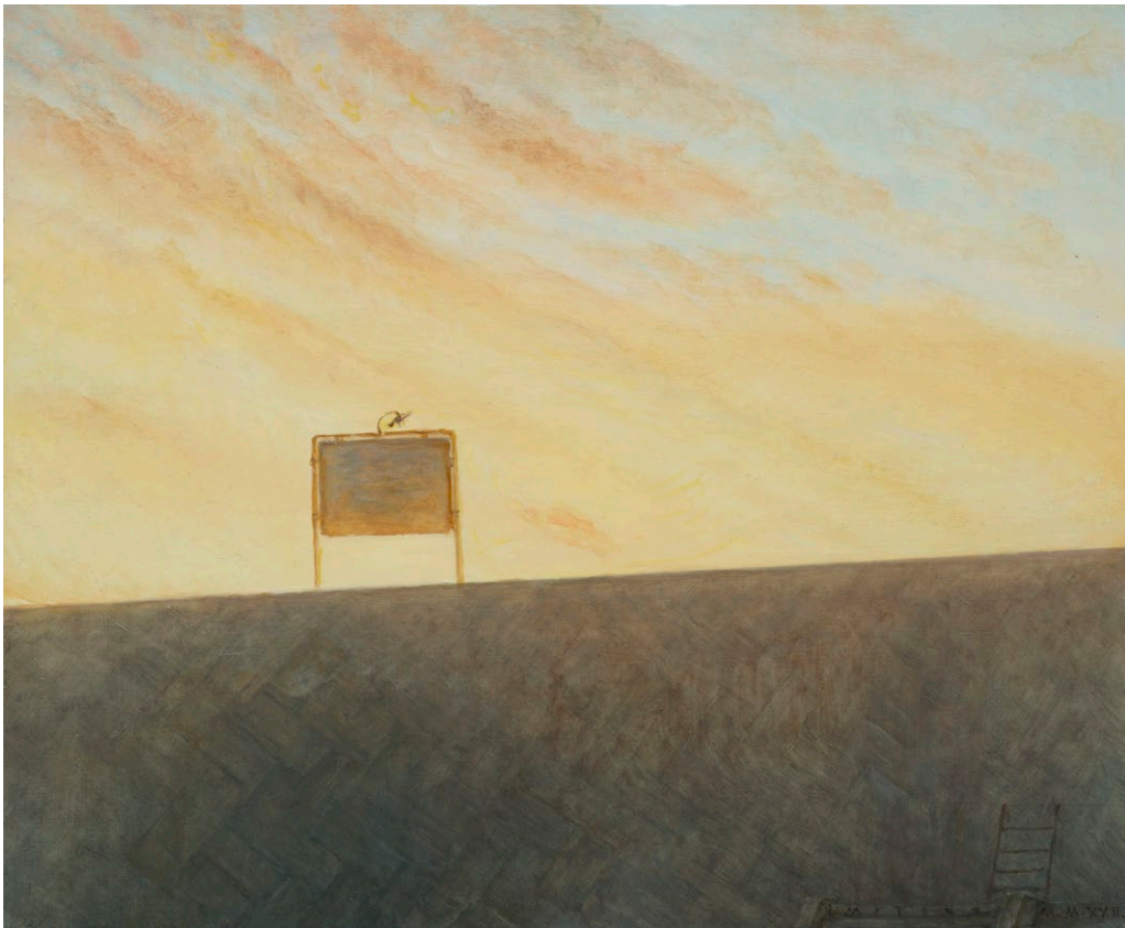
Sans titre , huile sur bois, 22 x 28.5 cm, 2022 Sans titre , huile sur bois, 29 x 35 cm, 2022