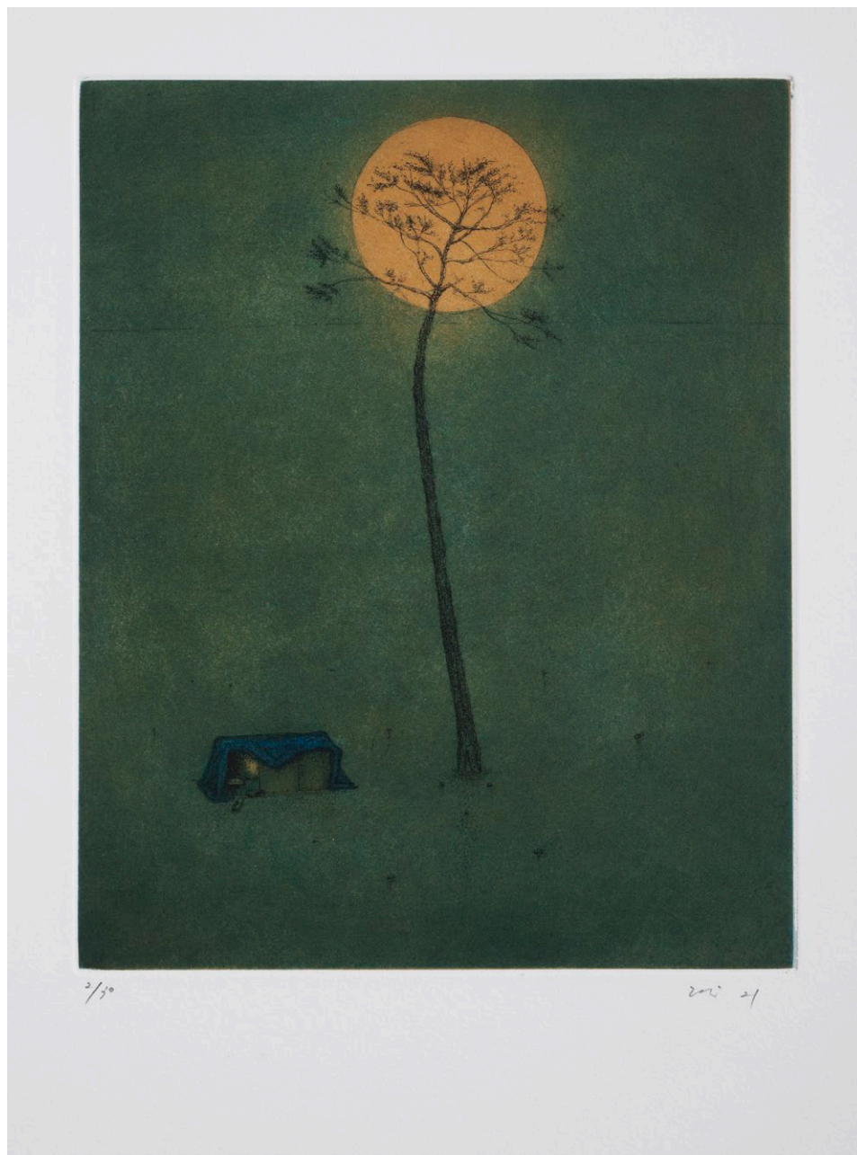
Sans titre , Gravure à l'eau-forte et à l'aquatinte sur papier, 56 x 45 cm, 2021