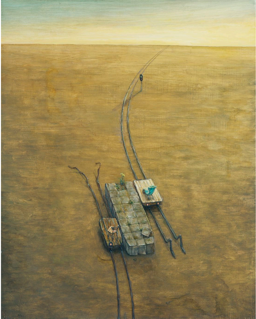
Sans titre , huile sur bois, 45.5 x 36.5 cm, 2021