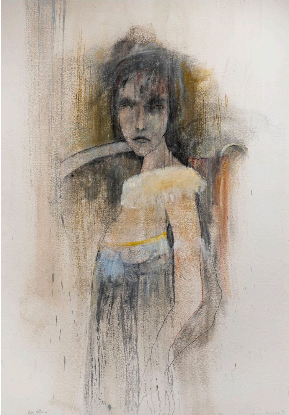
Technique mixte sur papier Arches, 101 x 80 cm, 2016