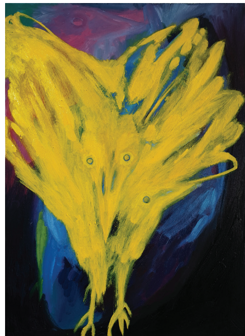
huile sur bois 2019 à 2021, 36x36 cm