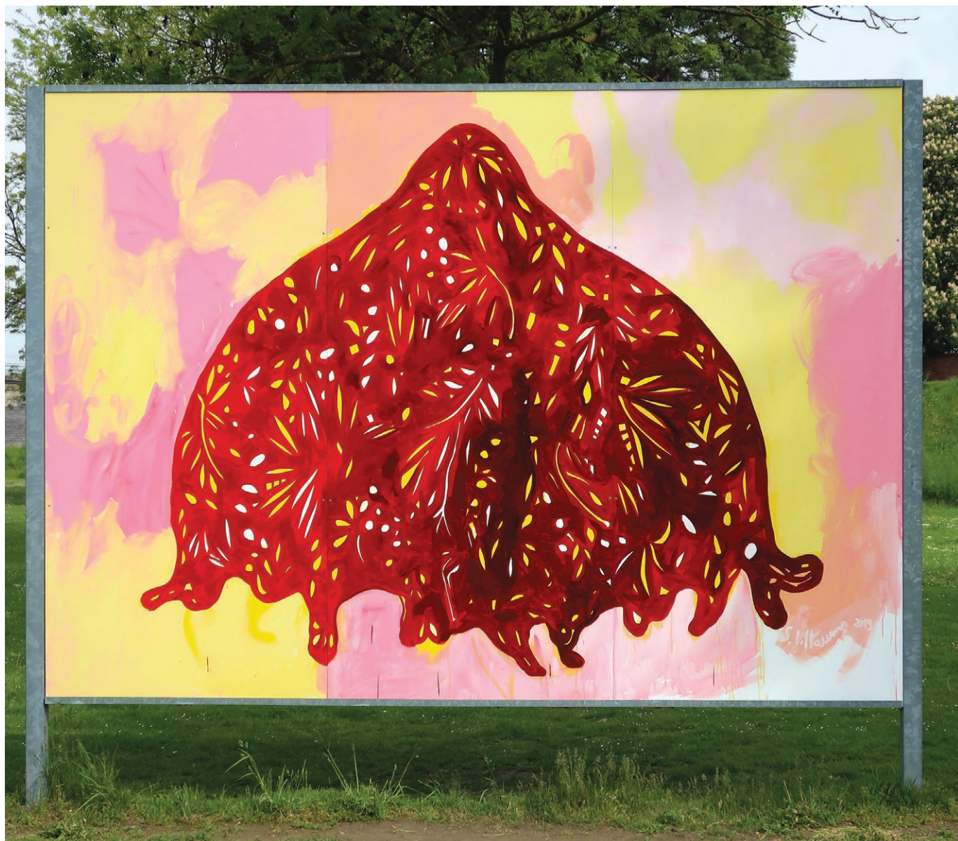
Sein acrylique sur bois 2019, 260x360 cm