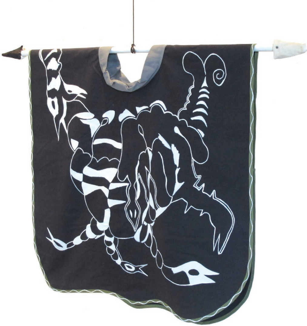
Épouvantail bête acrylique sur tissu (recto-verso) 2015, 80x76 cm