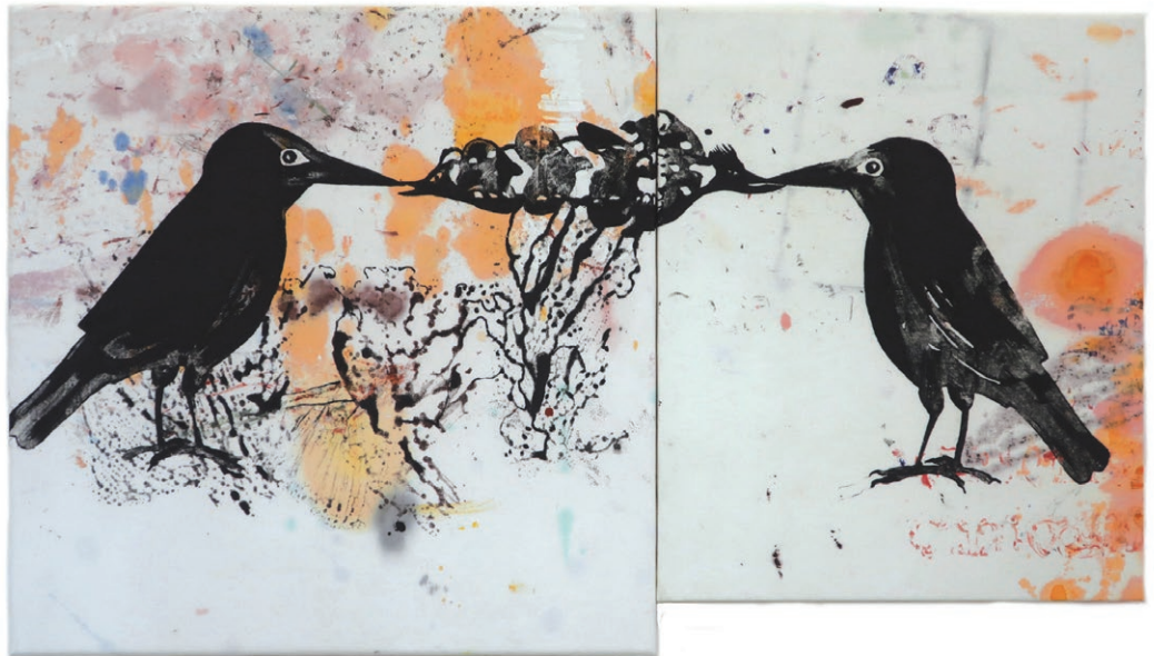
acrylique sur tissus 2019, 60x106 cm