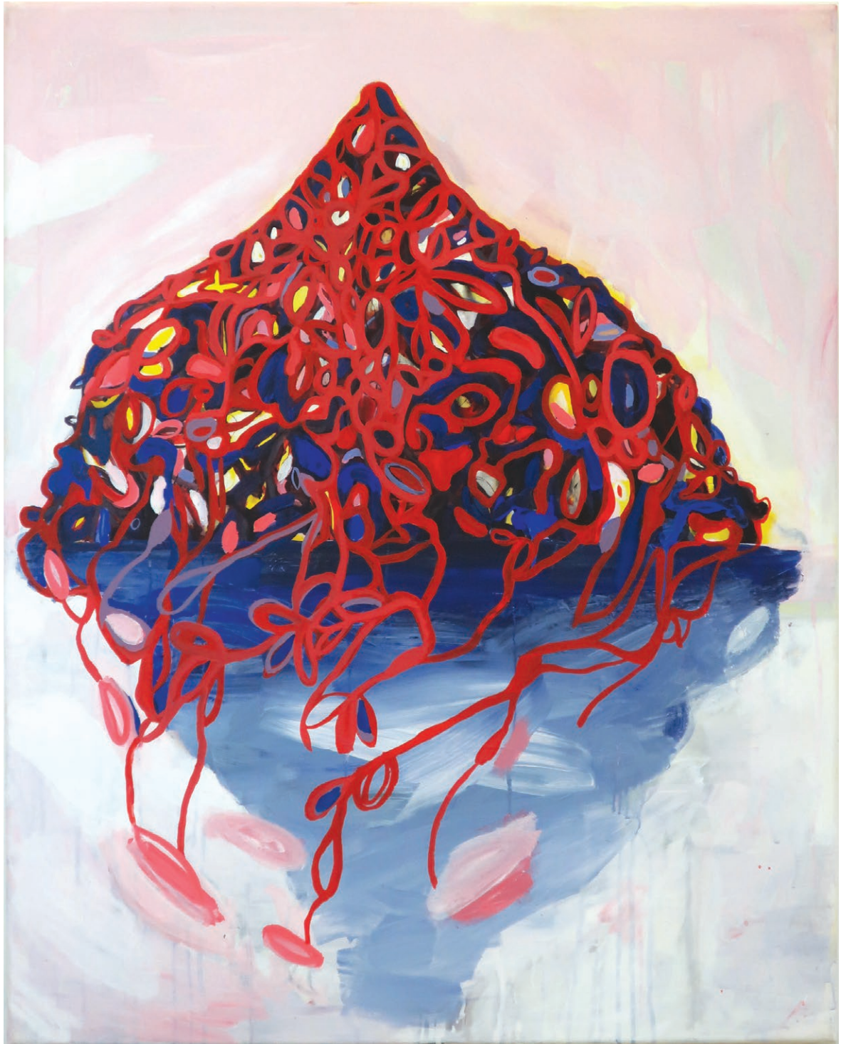
Montagne acrylique sur toile 2018-2019, 100x80 cm