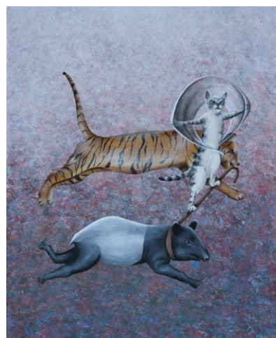
Le chat qui ne savait pas voler

Samedis, dimanches de 14h à 19h et sur rendez-vous (tél. 06 85 22 95 42)