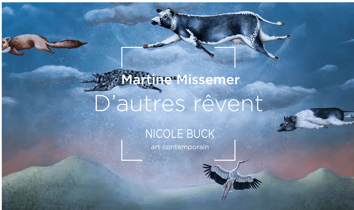
La migration - détail

“En peinture tout est possible, tout ce dont je rêve, je le fais exister...”