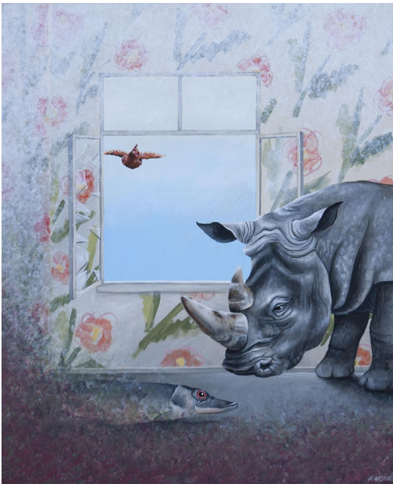
Une histoire d'amour