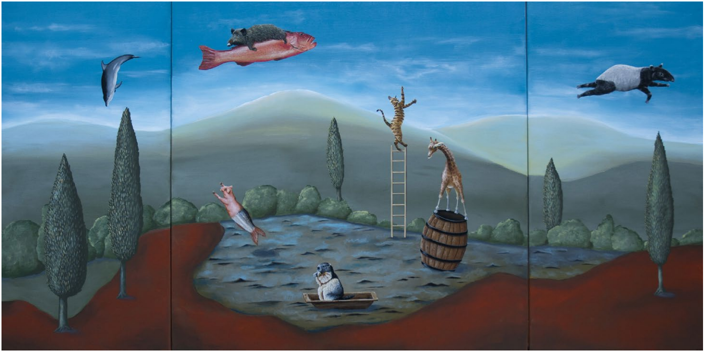
Les amis de l'étang